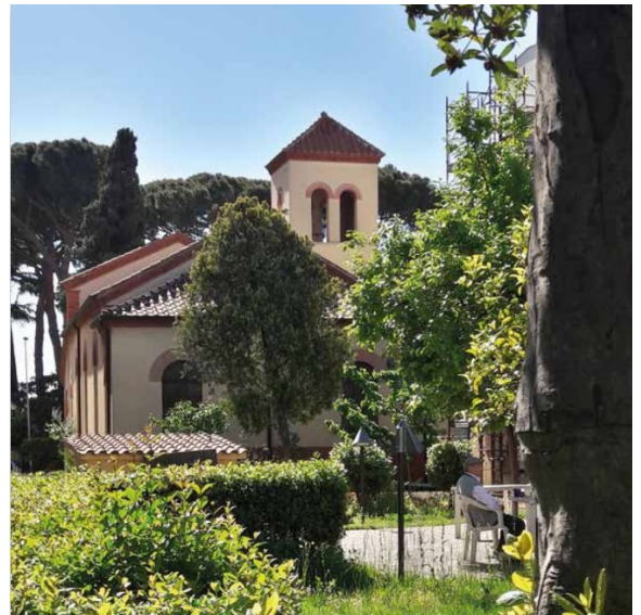
Chiesa Cristiana Evangelica Battista Roma Centocelle

Culto in presenza ogni domenica alle 11.00