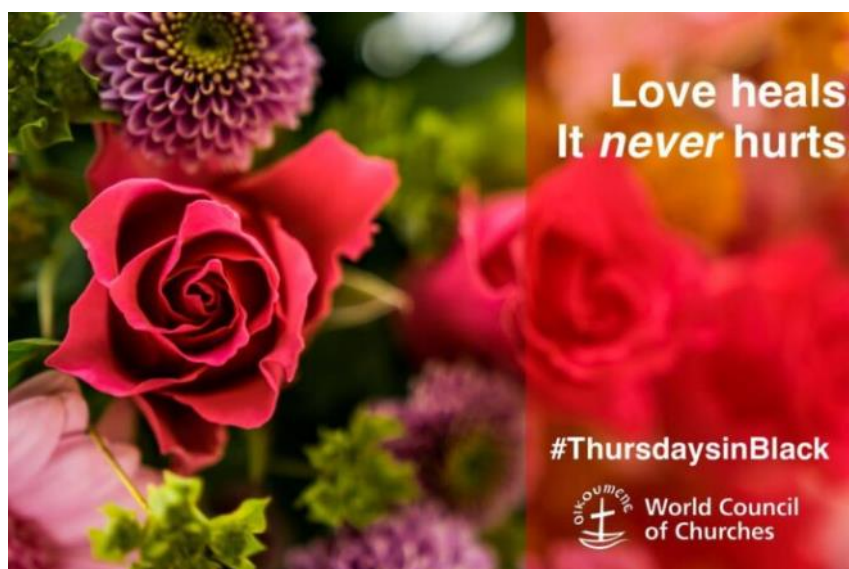
Una delle social card del WCC per il 14 febbraio

Roma (NEV), 11 febbraio 2021 – “L’amore cura, non ferisce”. Un San Valentino diverso dal solito, molto poco commerciale e più di sostanza. Lo propone il Consiglio ecumenico delle chiese (CEC), lanciando una campagna social in occasione del 14 febbraio.