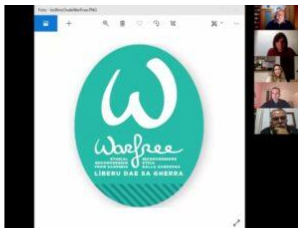
WarFree - Webinar 19/02/2021