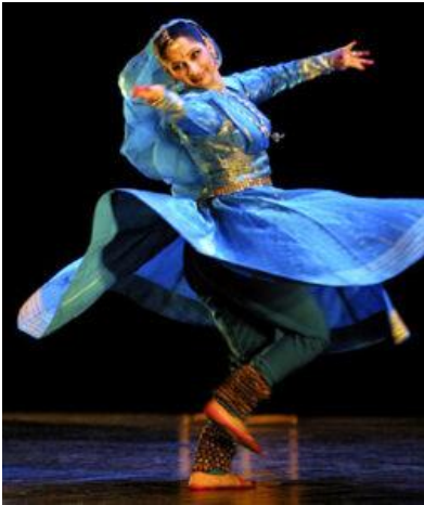
danza Kathak, immagine tratta da http://www.apsarasdance.com/container.php?area=danzeindiane