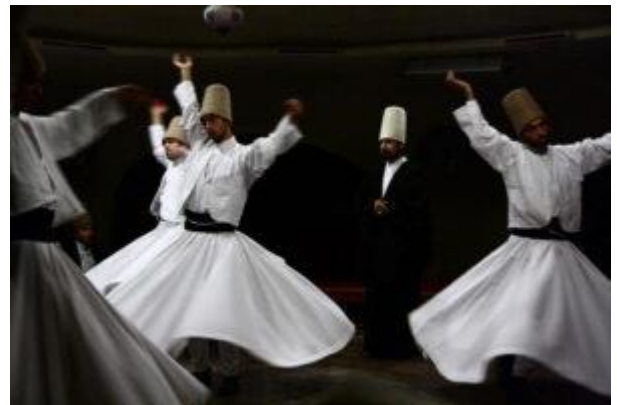
Danza sufi.

Una volta lanciata la proposta, è accaduto l’impensabile. Ballerini professionisti che si sono prestati a insegnare i passi, un numero inaspettato di adesioni, anche di una persona che non era mai entrata in chiesa. E un nuovo battesimo. Una “lenta uscita dalla tomba”, l’ha descritta il pastore. Che ora rilancia la sfida ad altre chiese di una #jersualemachallenge per quest’estate.