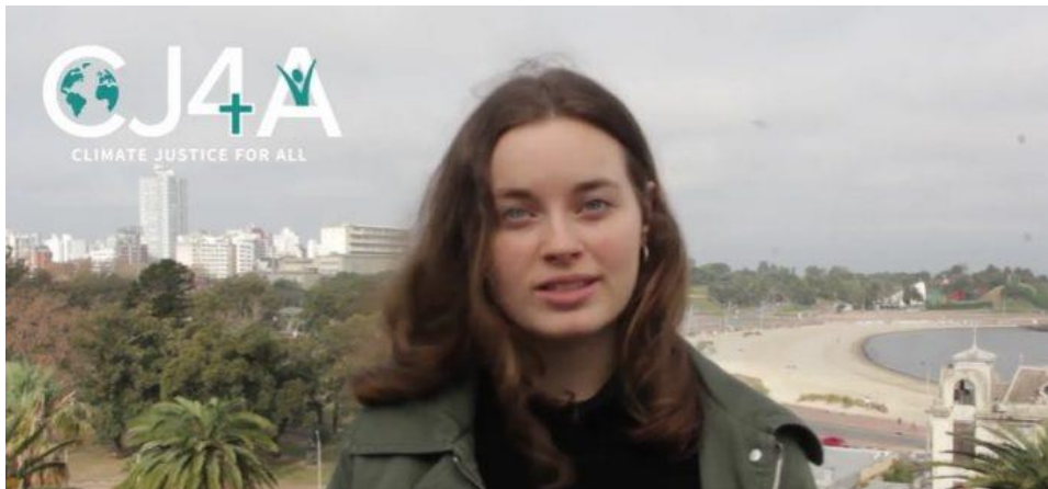
Un frame dal video della campagna CJ4A - Uruguay

Roma (NEV), 8 luglio 2021 – La campagna guidata dalle giovani e dai giovani della famiglia metodista globale per il clima propone un nuovo video. Obiettivo: un coinvolgimento diretto di persone, comunità e governi, in vista della Conferenza delle Nazioni Unite sui cambiamenti climatici ( COP26 ). La COP26 si terrà a Glasgow dall'1 al 12 novembre 2021, sotto la presidenza del Regno Unito.