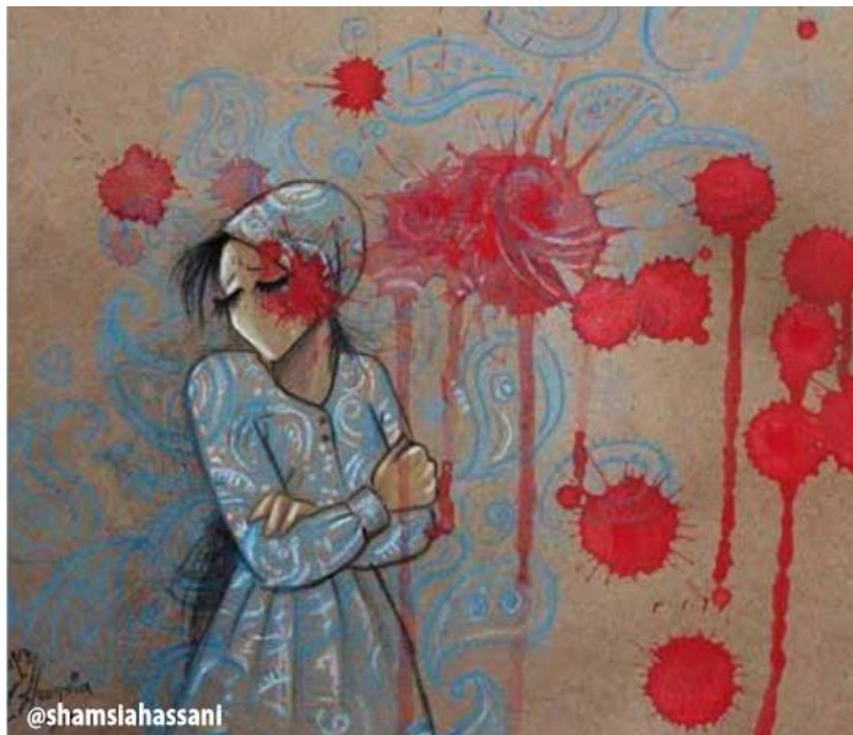
Immagine di Shamsia Hassani, artista afghana. Tratta dal fascicolo FDEI 16 giorni contro la violenza 2022

Roma (NEV), 9 dicembre 2022 – Con oggi, si conclude il ciclo a puntate che ha visto pubblicare, giorno per giorno, gli approfondimenti del fascicolo “16 giorni contro la violenza” curato dalla Federazione delle donne evangeliche in Italia (FDEI). I 16 giorni vanno dal 25 novembre, Giornata internazionale per l’eliminazione della violenza contro le donne, al 10 dicembre, Giornata dei diritti umani. Per rivedere la presentazione ufficiale del fascicolo, clicca qui . Per vedere tutte le puntate, clicca qui .