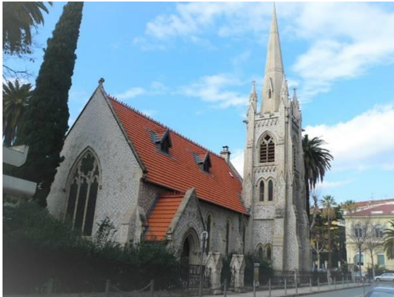
Chiesa protestante unita di Nizza "Saint-Esprit"

Domenica 28 maggio 2023 ore 9,55 diretta da studio: conduce Claudio Paravati ore 10,00 – 11,00: culto in Eurovisione sempre su RAI 3