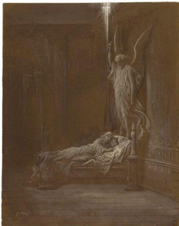
Gustave Doré, La chiamata di Samuele